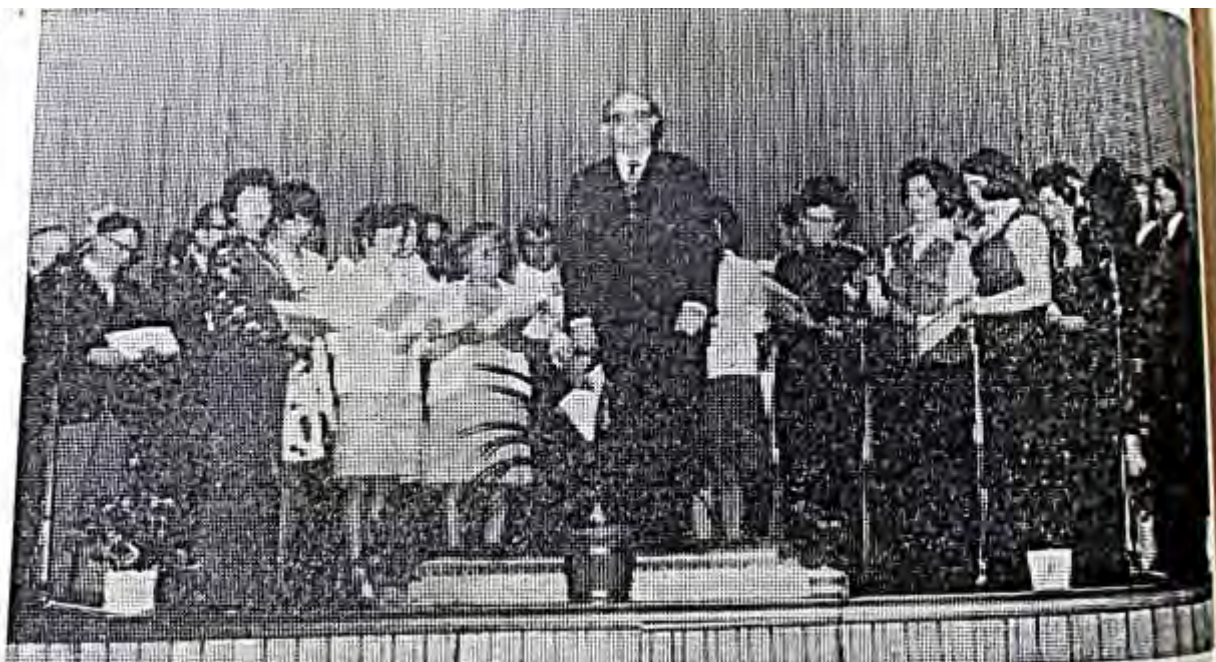
Alle Chöre der Großgemeinde beteiligten sich am ersten Waldecker Stadtkonzert am Samstag in Freienhagen. Den Konzertreigen eröffnete der Gemischte Chor Freienhagen (unser Foto). (Fotos: ...)