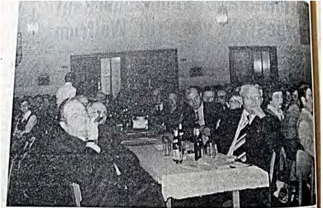
Chorkonzerte einzelner Chöre haben nicht selten unter Besuchermangel zu leiden. Anders ist es bei den Gemeinschaftskonzerten, wie sie in Korbach, Mühlhausen und am Sonnabend in Freienhagen veranstaltet wurden. Überall hatten die Sänger ein „volles Haus“, wie unser Foto aus der Freienhagen-Festhalle zeigt.

Im Anschluß an das Konzert, vom Publikum mit viel Interesse verfolgt, spielten die „Bergvagabunden“ zum Tanz auf. (Rg)