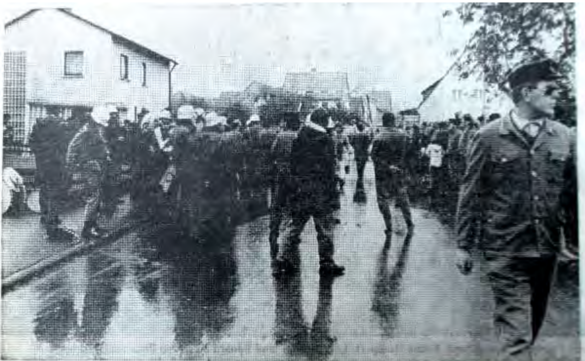
Mit großem Interesse verfolgten zahlreiche Zuschauer Einsatzübungen und Geräteschau der Freiwilligen Feuerwehren der Stadt Waldeck am Sonntagmorgen in Sachsenhausen.

Nach Demonstrationsfahrt „Kür-übungen“ dar Stadtteilwehren in Sachsenhausen