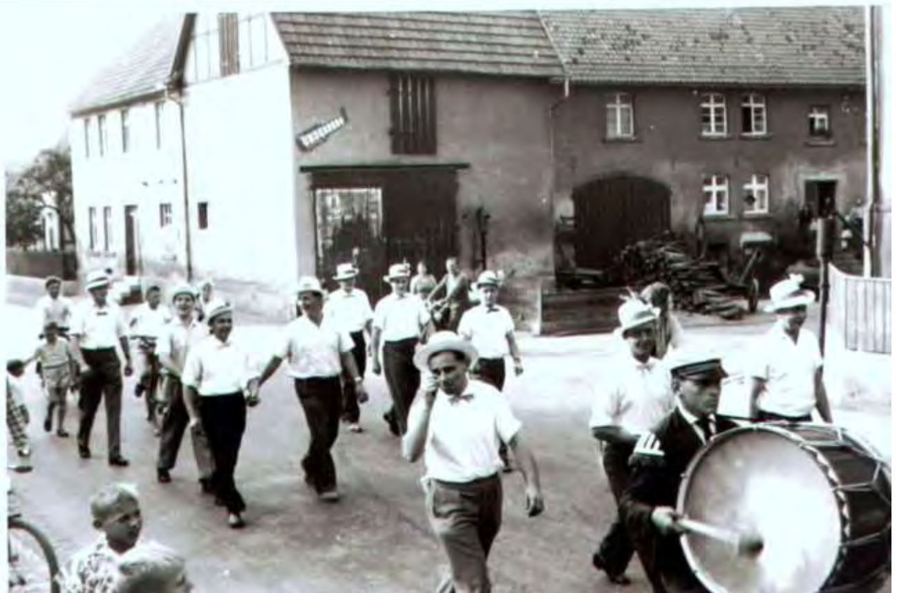
Kirmesbursche war ich öfter mal. Hier Bilder aus dem Jahr 1959