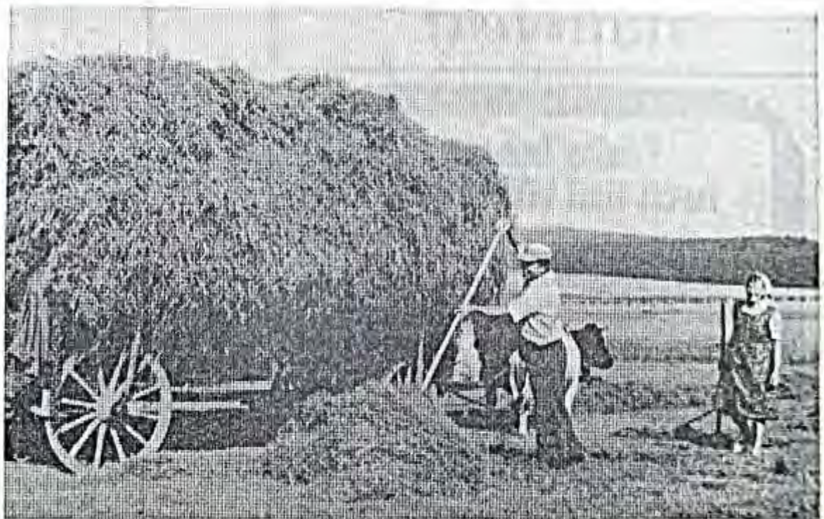
Noch vor wenigen Jahren war es gemütlicher, als mit dem Kuhgespann die Heuernte eingebracht wurde.