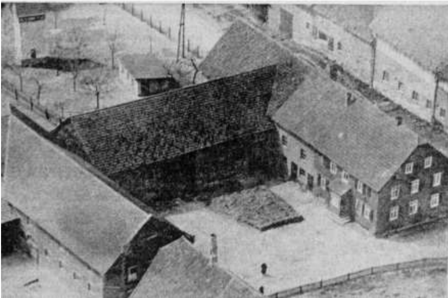
Abriss in den 1970er Jahren